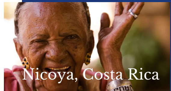
Nicoya, Costa Rica

Blue Zones® sada je zaštitni znak Blue Zones, LLC, i odražava životni stil i okoliš najdugovječnijih ljudi na svijetu. Više o plavim zonama u našim sljedećim susretima.