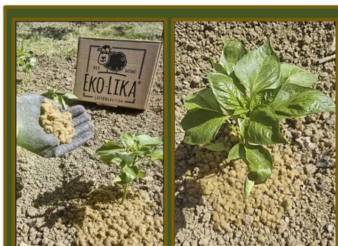
Woolee pahuljice zaštita / malč