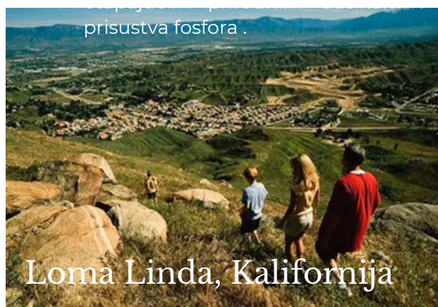
Loma Linda, Kalifornija